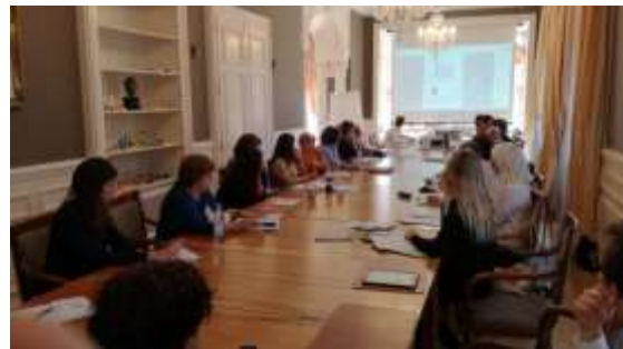
Reunión Anual de TGE (Ginebra, octubre de 2018)

En los últimos diez años, TGE ha canalizado más de 70 millones de euros . Durante 2017, TGE gestionó 4.844 donaciones internacionales (91,5% individuales y resto de empresas) a 350 entidades beneficiarias (20 recibieron más de 100.000 euros) por un importe total de más 10,5 millones de euros . Fueron destinadas sobre todo a proyectos de educación, salud y cooperación internacional .